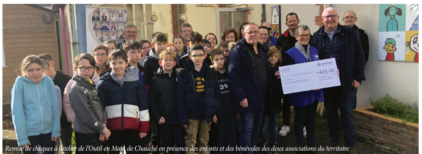
Remise de chèques à l'atelier de l'Outil en Main de Chauché en présence des enfants et des bénévoles des deux associations du territoire

C'est le montant versé aux associations L'Outil en main du territoire soit 211.55 € pour Chauché et 211.55 € pour Essarts-en-Bocage.