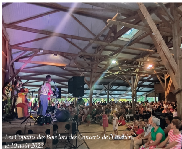
Les Copains des Bois lors des Concerts de l'Oiselière, le 10 août 2023

« Un été musical et conté », initié par l'Office de tourisme, véritable temps fort pour notre territoire, revient du 18 juillet au 22 août.