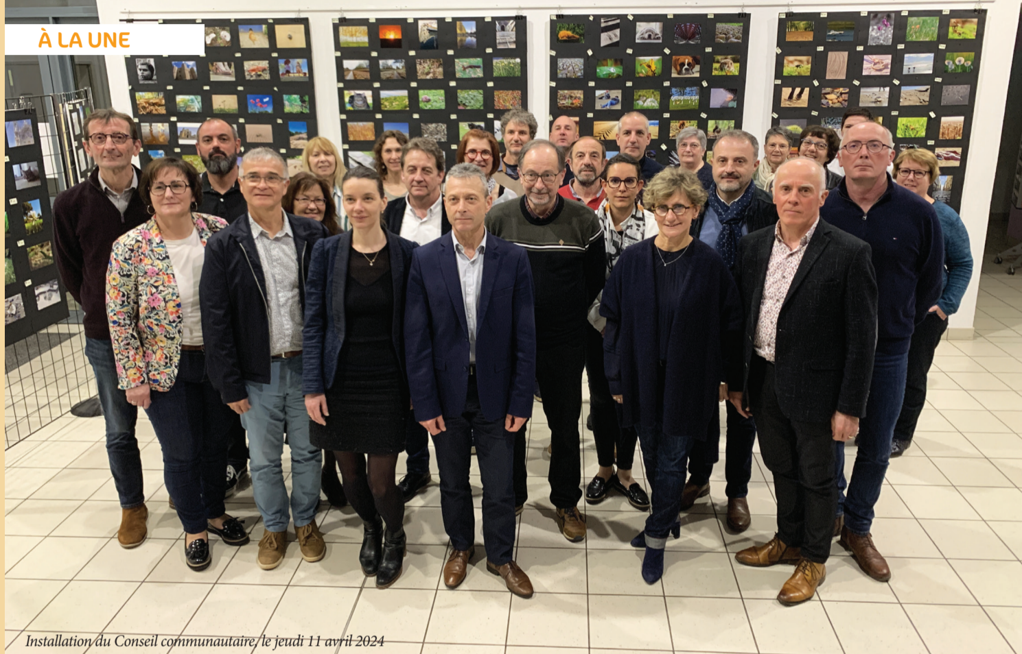
Installation du Conseil communautaire, le jeudi 11 avril 2024